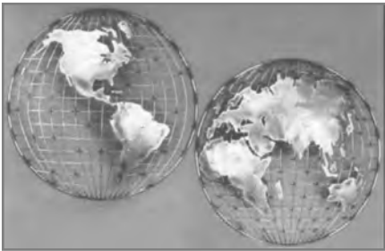
Hemisferios de bronce #100269 www.cowboyindian.com Precio: $380